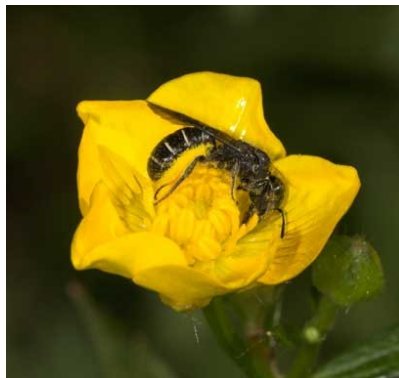
trinkt Nektar / sammelt Pollen