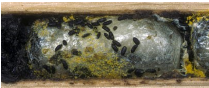
verpuppte junge Biene