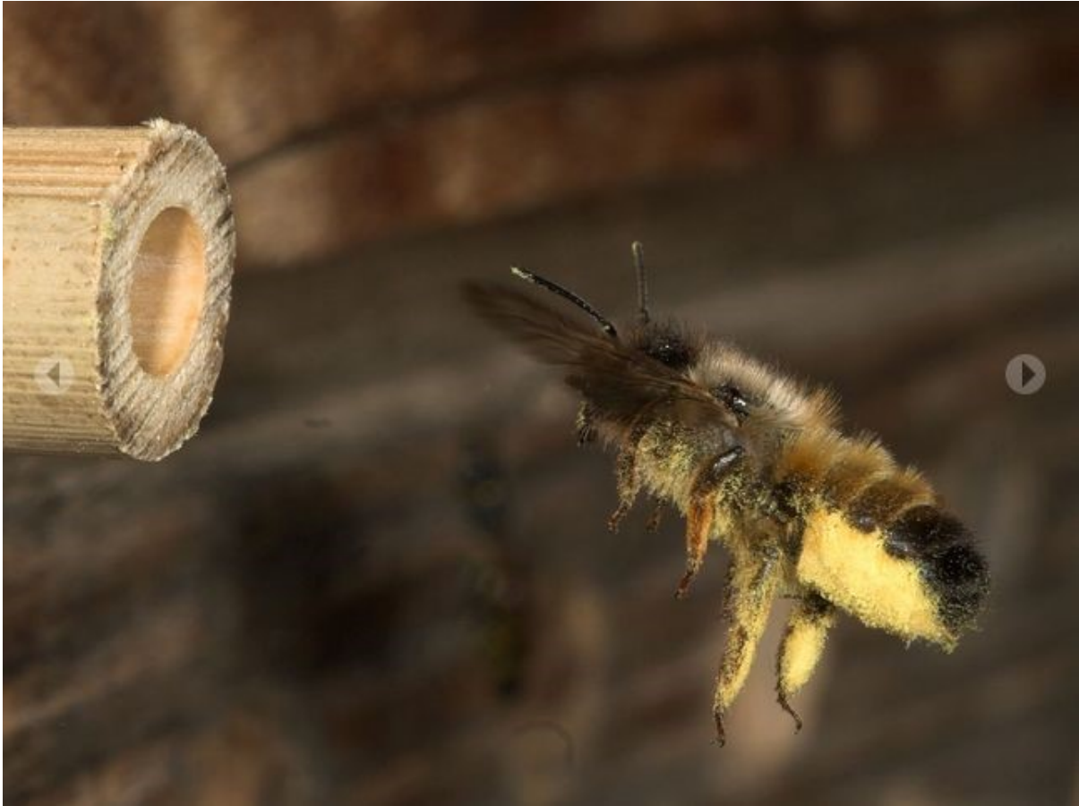
Biene fliegt mit Pollen zur Brutröhre