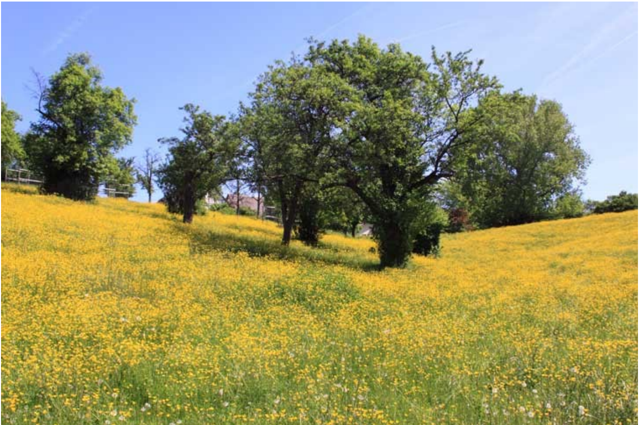
Lebensraum der Biene: Wiese mit viel Hahnenfuss und alten Bäumen mit Totholz