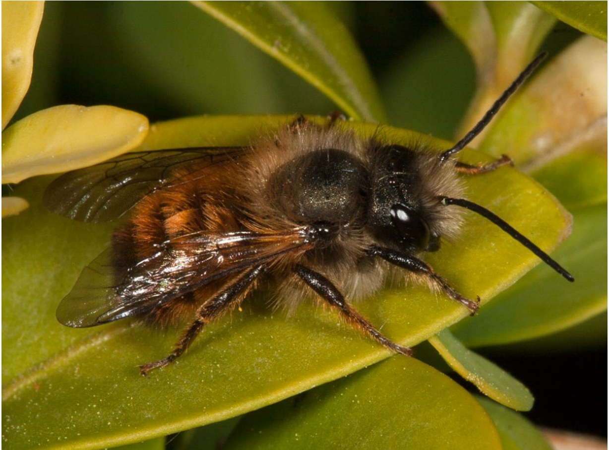
Rostrote Mauerbiene: Männchen am „sünnele“