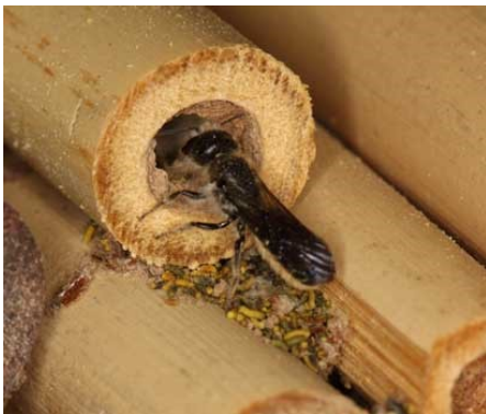
Biene putzt altes Nest