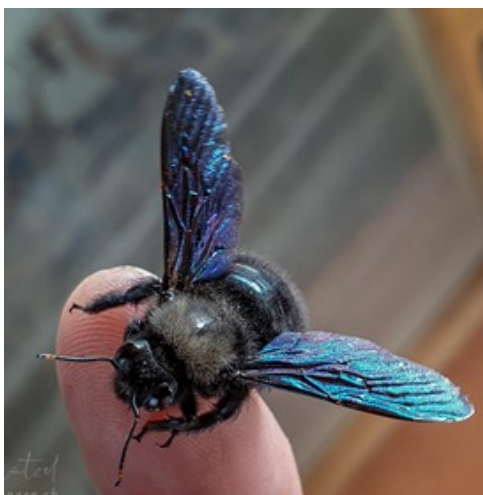
Blau Holzbiene - 14-28 mm