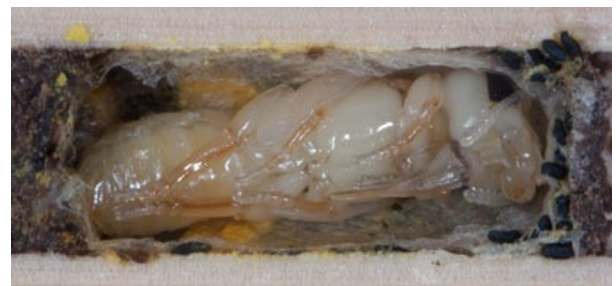
junge Biene, noch nicht ausgefärbt