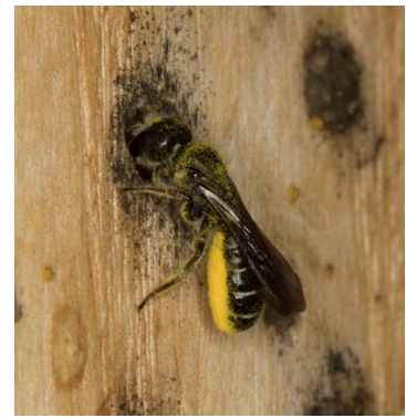
bringt Pollen in die Brutröhre