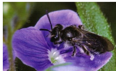
Blau Ehrenpreis-Sandbiene - 6-7 mm.