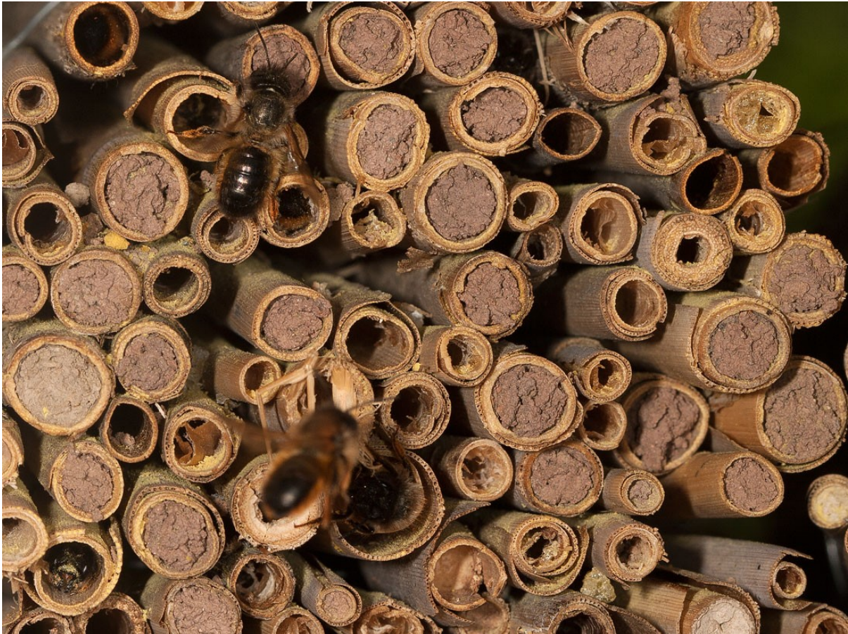
In vielen Schilfhalmen wurden bereits Nester angelegt und mit Lehm verschlossen.