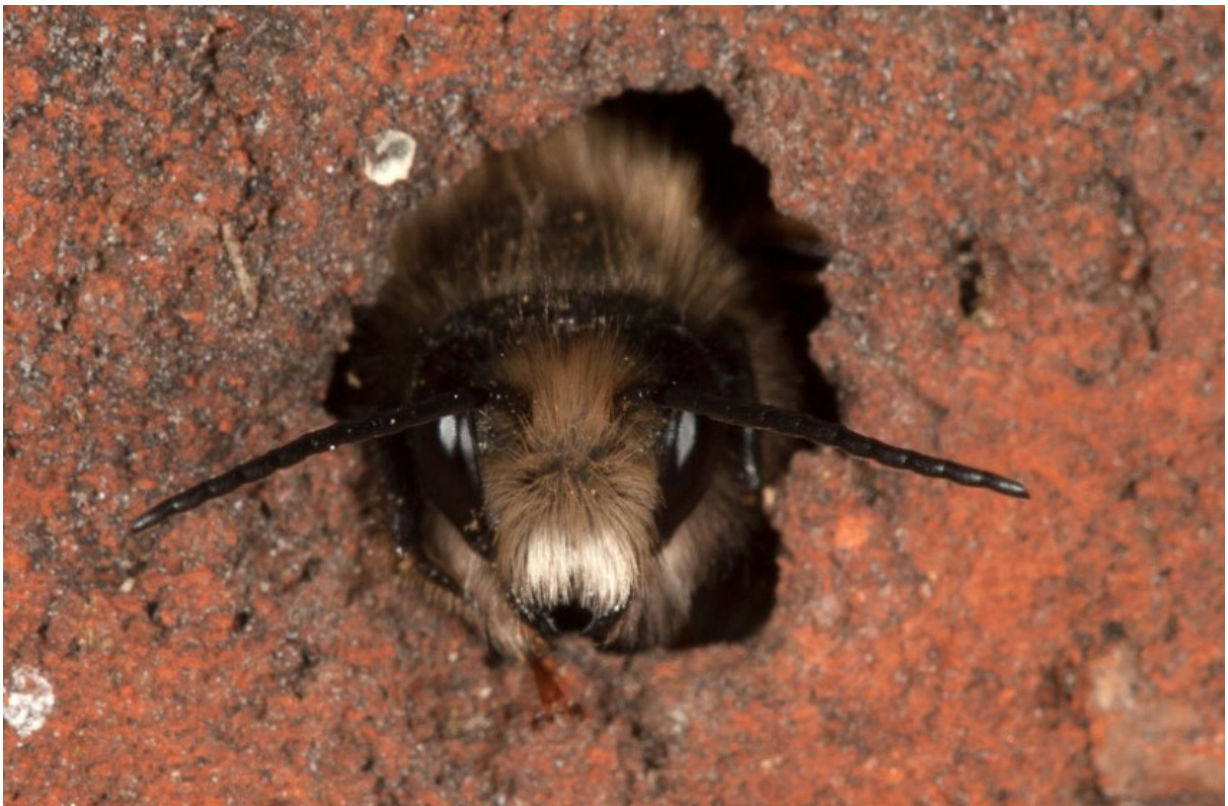
Männchen schaut aus einer Niströhre heraus.